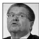
Министр экономического развития Алексей УЛУХАЕВ со-

общил, что рост ВВП по итогам года ожидается на уровне 1,4–1,5%, инфляция составит 6,4–6,5%. При этом рост промышленности и инвестиций находится на нулевом уровне. Однако аналитики с ним не согласны.